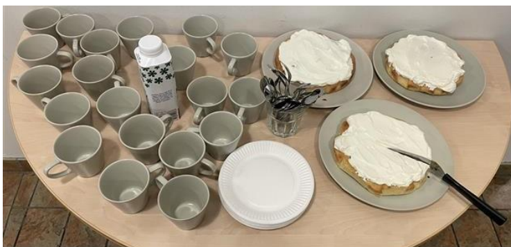
Porchettan och semle-kladdkakan.